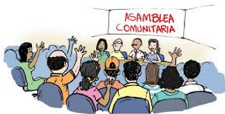
CONSEJO ESCOLAR DE PARTICIPACIÓN SOCIAL

Ayudar a su hijo(a) a describir algunas formas de participación social y política que los ciudadanos pueden utilizar para comunicar necesidades, demandas y problemas colectivos que permitan construir una sociedad democrática y libre de violencia.