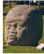
Cabeza de olmeca.