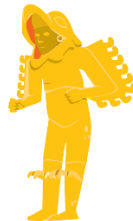
Guerrero mexicana, periodo Posclásico