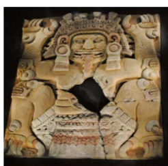
Tlaltecuilti. Señora de la Tierra. Museo de Templo Mayor.